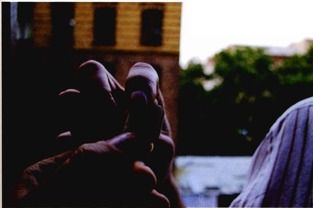
KATYA SANDER, WENN DU DIES LIEST, GEBE ICH ES DIR, 2005, BADGE MED TRYK, BERLIN

En anden måde, hvorpå hun med simple midler viste, at det offentlige rum også er et 'diskursivt', et sprogligt, rum, var et samarbejde med Neuer Berliner Kunstverein i 2005. Her produce-